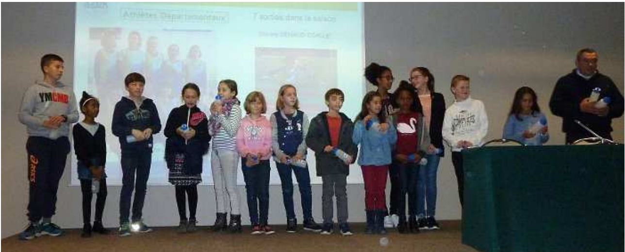
Les enfants récompensés pour leurs participations 2017