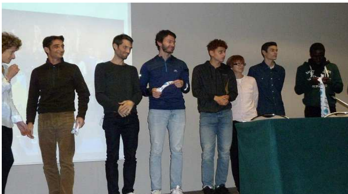
Notre élite Inter-régionale et Nationale