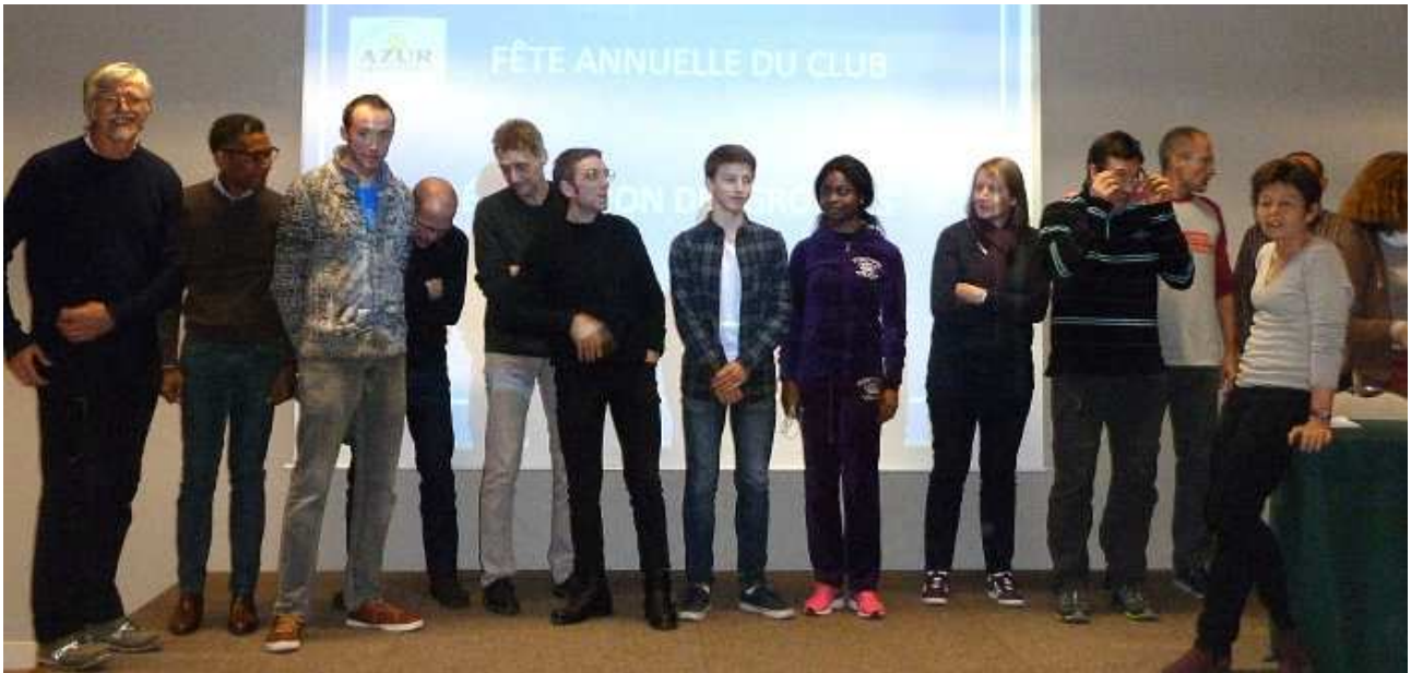
L'encadrement sans les entraîneurs retenus aux championnats départementaux