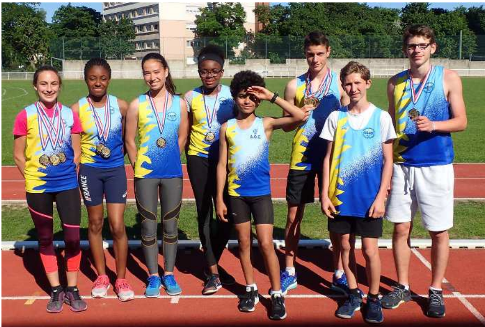
La moisson des championnats départementaux des jeunes...